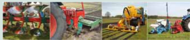
Foto 1: Werktuigen voor grondbewerking. Van links naar rechts: ploeg, NKG vol-veld, Strokenfrees, beperkt woelen + zaaien.

Oppervlakkige grondbewerking voor het snijden van stoppels, verwijderen van onkruid, inwerken van groenbemesters, egaliseren en zaaibedbereiding, vindt onder andere plaats met een vleugeltandcultivator, rotoreg, pennenvrees en verkruiemrol. Ook de bemesting en het zaaien/poten moeten in de werkgang een plek krijgen.