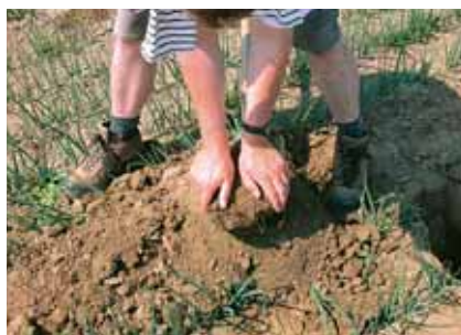
6. Breek en beoordeel de kluit