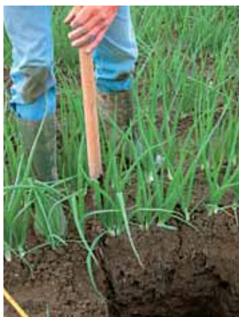
3. Steek een kluit uit