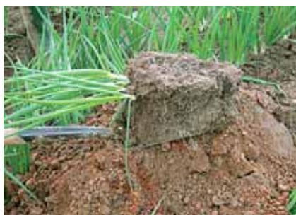
5. Leg de kluit op de grond