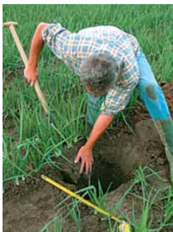
4. Haal de kluit naar boven