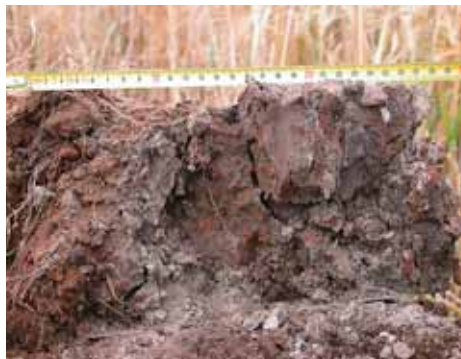
Roest duidt op water fluctuaties