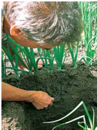
2. Beoordeel de profielwand