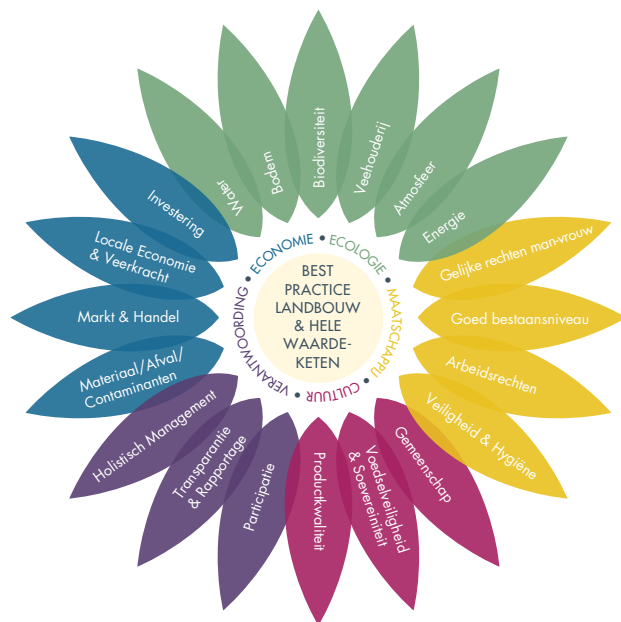
FIGUUR 2 | DE VIJF DIMENSIES VAN DUURZAAMHEID EN DE 20 BIJBEHOORENDE CRITERIA UIT DE BEST PRACTICES GUIDELINE FOR AGRICULTURE AND VALUE CHAINS (BRON: SOAAN EN IFOAM ORGANICS INTERNATIONAL, 2013)