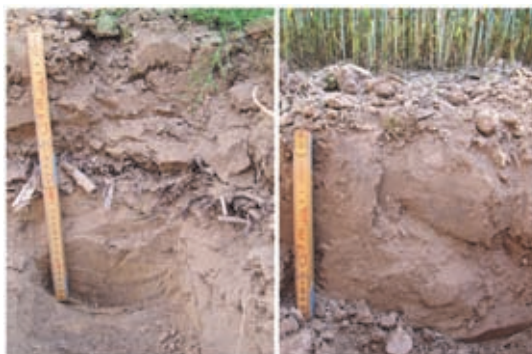
Foto 1 en 2: Ploegen (links) vergeleken met nkg (rechts) in proefvelden met tarwe in Tongeren. Bij ploegen is de structuur van de geploegde laag van 0-17 cm mooi. Scherpblokkige elementen zijn vrijwel afwezig. Daaronder bevindt zich de slecht verteerde resten van de maïs van het vorige teeltseizoen en daaronder een extreem verdichte laag. Toch kunnen wortels door deze verdichte laag door de aanwezige verticale wormgangen. Onder 45 cm is de bodemstructuur weer zeer poreus en goed doorwortelbaar.

Bodemstructuur, beworteling en bodemlevenactiviteit zijn kwalitatief beoordeeld. Het effect van nkg verschilde per grondsoort: op zwaardere gronden leidde nkg tot iets meer bodemlevenactiviteit en een betere structuur in de bovenste 30 cm dan ploegen. Op zand leidde nkg juist vaak tot verdichting onder de bewerkte laag, resulterend in een minder goede beworteling. Bij kerende grondbewerking waren vaak nog gewasresten aanwezig net beneden de bewerkte laag terwijl deze met nkg al verteerd waren (Foto's 1 en 2).