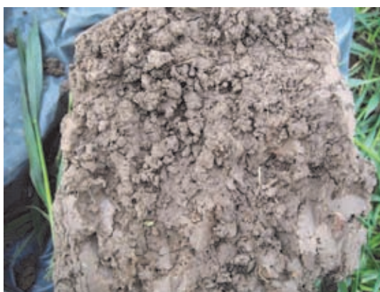
Foto 2 & 3: Op 20 cm. diepte is de bodemstructuur bij niet-kerende grondbewerking extreem verdicht (boven). Bij ploegen is de grond op 20 cm. diepte veel lossier

De tarweopbrengsten zijn bij beide systemen vergelijkbaar. Mochten de regenwormen op langere termijn de grond dieper losmaken dan niet-kerende grondbewerking gunstiger uitpakken. Op zware gronden zijn het de regenwormen die helpen om bij niet-kerende grondbewerking een goed resultaat te krijgen: