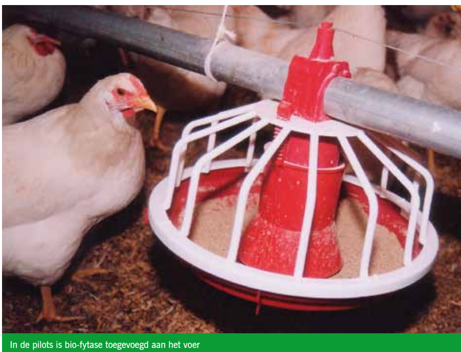
In de pilots is bio-fytase toegevoegd aan het voer

was het fosfaatgehalte in de verse mest 18% lager dan bij de uitgangsmeting. Vervolgens werd weer omgeschakeld naar standaard-voer. Twee weken na het omschakelen steeg het fosfaatgehalte met 14%. Het stikstofgehalte in de verse mest leek in eerste instantie licht te stijgen na het overschakelen op voer met Synergen, maar daalde vervolgens weer. Toevoeging van bio-fytase bevordert namelijk ook de ontsluiting van eiwitten en mineralen uit plantaardige producten. Vermoedelijk komt er dus door de verbeterde eiwitbenutting ook minder stikstof in de mest terecht. Hierdoor was er in eerste instantie niet veel effect op de stikstof/fosfaat verhouding in de mest. De verhoogde voerefficiëntie is voor de pluimveehouder interessant, maar voor de akkerbouwer is de mestkwaliteit hierdoor nog niet verbeterd, misschien zelfs verslechterd omdat er minder stikstof en fosfor per ton in zit.